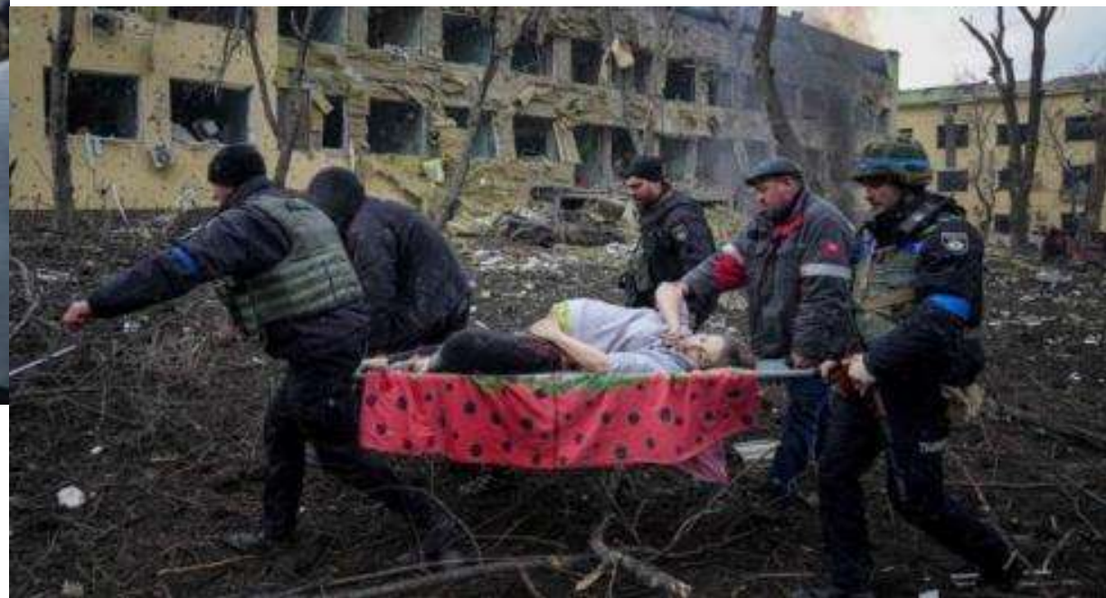
Після російського обстрілу пологового будинку