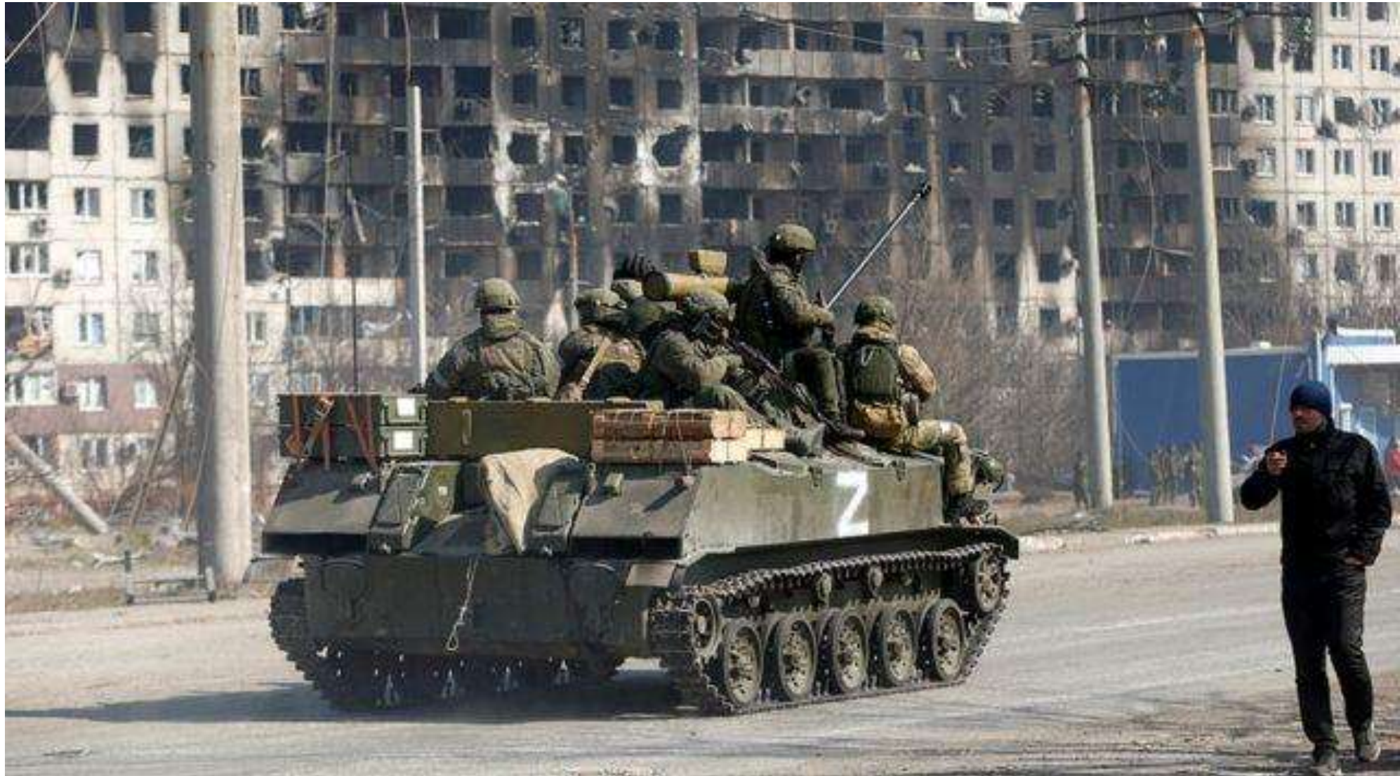
Окупанти на вулиці зруйнованого ними Маріуполя