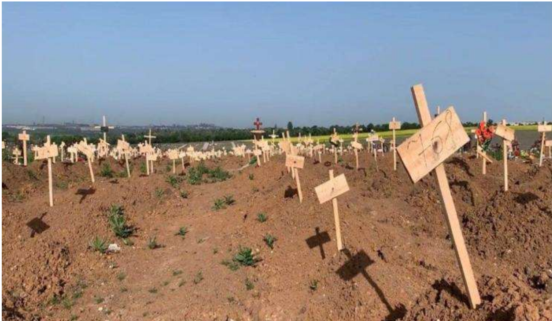
Безіменні могили на маріупольському цвинтарі після повномасштабного вторгнення Росії