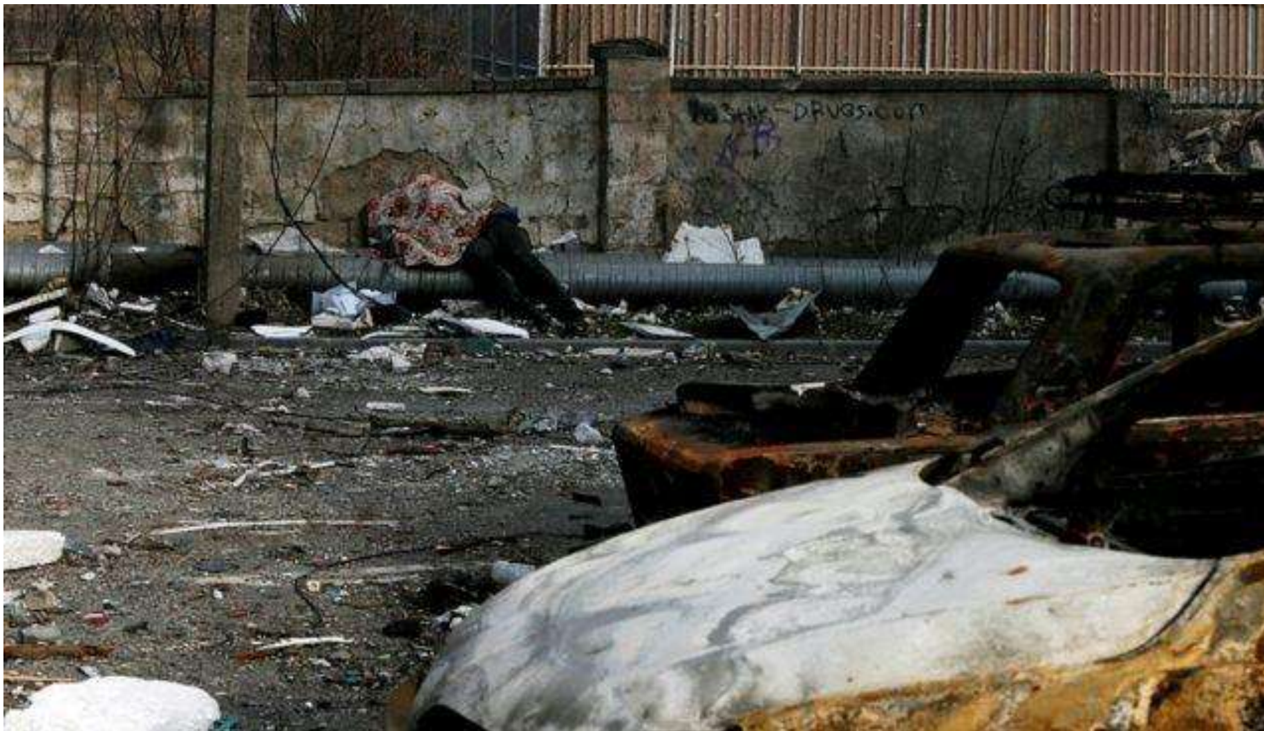
Тіло загиблого мешканця на вулиці у Маріуполі, 27 березня