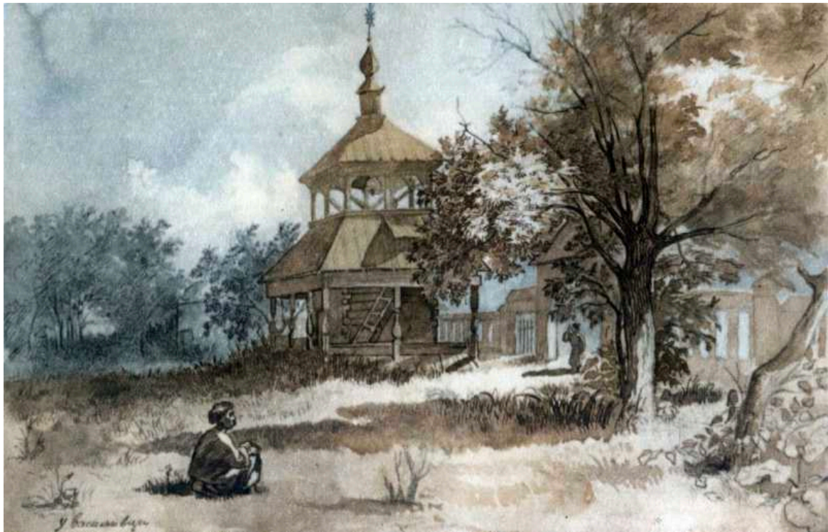
Т.Г.Шевченко. У Василівці. Акварель. [Жовтень 1845]. Зворот арк. 19 альбому 1845 р

М. Якимчук , здобувачка другого (магістерського) рівня вищої освіти ОП «Культурологія, культурне розмаїття та розвиток громади» спеціальності 034 Культурологія кафедри культурології Маріупольського державного університету