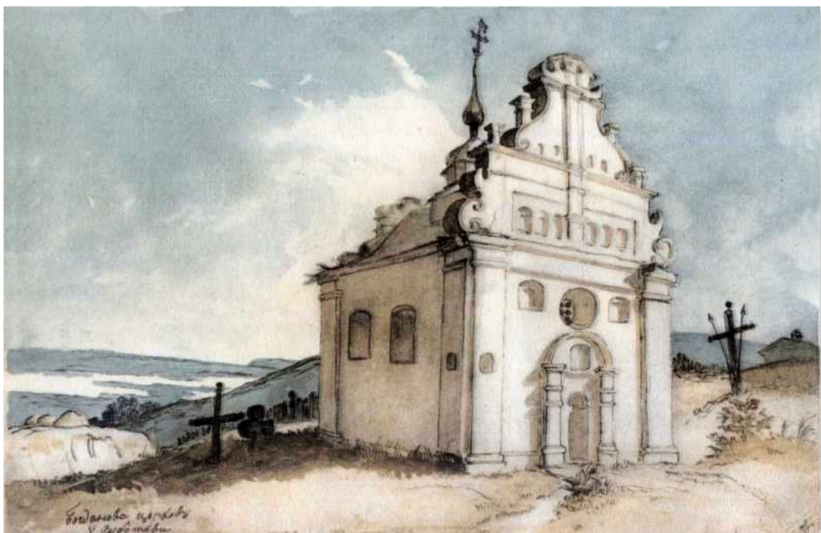
Т.Г.Шевченко. Богданова церква у Суботіві. Акварель. [IV—X 1845]