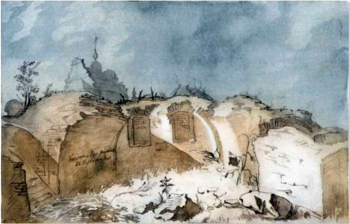
Т.Г.Шевченко. Богданові руїни в Суботіві. Акварель. [IV—X 1845]